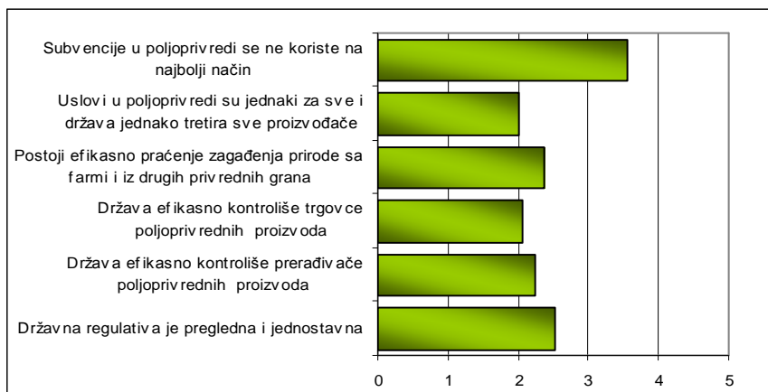
Grafikon 1. Stavovi primarnih proizvođača o regulativi u Republici Srbiji (Anketno istraživanje)

U cilju dobijanja ocene o poznavanju regulative, primarnim proizvođačima i prerađivačima su postavljena pitanja gde su oni svojim odgovorima izrazili stepen svog slaganja ili neslaganja sa tvrdnjama u vezi sa zakonskom regulativom u Srbiji. Odgovori su mogli da se kreću od "uopšte se ne slažem" (ocena 1) do "potpuno se slažem" (ocena 5).